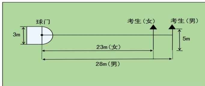
图 1 传准场地示意图

（1）考试方法：如图 1 所示，传球目标区域由一个室内五人制足球门（球门净宽度 3 米，净高度 2 米）和以球门线为直径（3 米）画的半圆组成，圆心（球门线中心点）至起点线垂直距离为男子 28 米，女子 23 米。考生须将球置于起点线上或线后（线长 5 米，宽 0.1 米），向目标区域连续传球 6 次，左右脚均可，脚法不限。